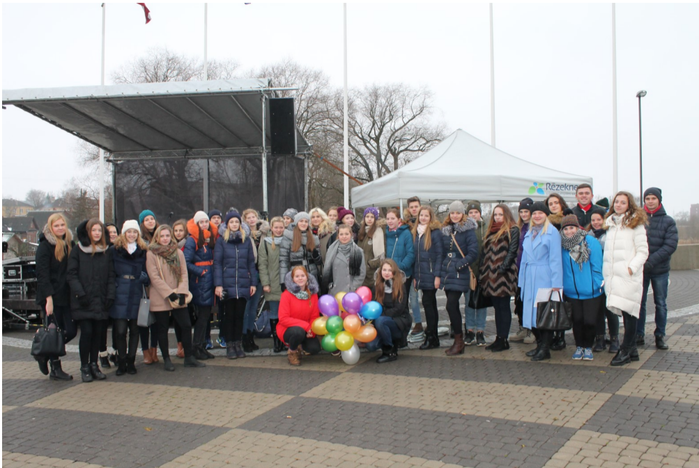
Skrējiena "Ielpo Rēzekni!" idejas autori- Rēzeknes pilsētas Jauniešu dome!