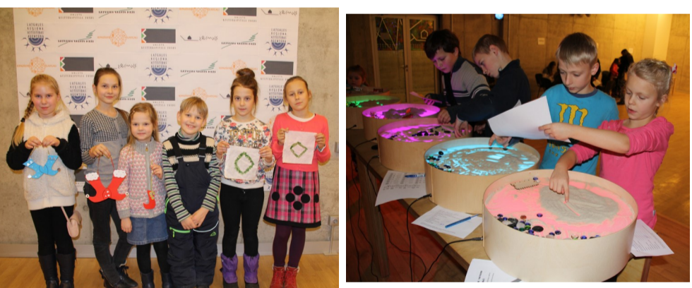
Projekta „Iepazīsti Latgali” noslēgums!