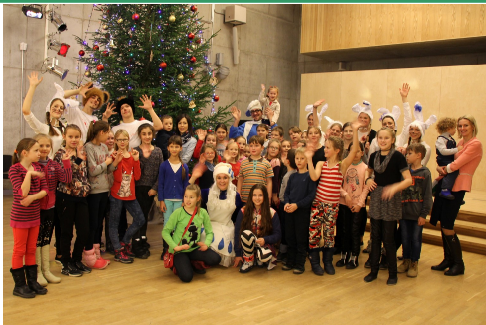
Ziemassvētku eglītes iedegšana!