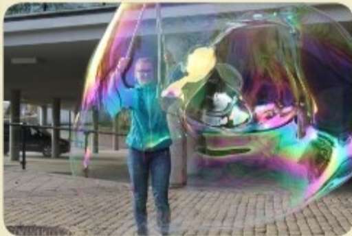
Nometne “5 dienas apkārt Eiropai”