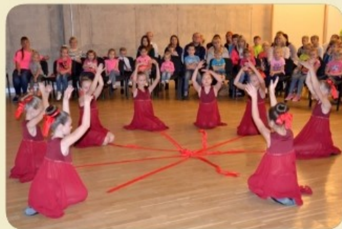
Pasākums “Tēja ar vecākiem”