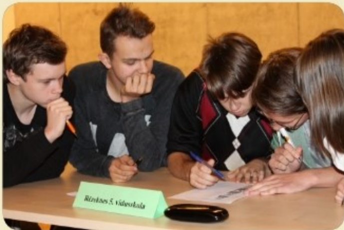
Konkursa “Erudīts 2017” pirmā spēle