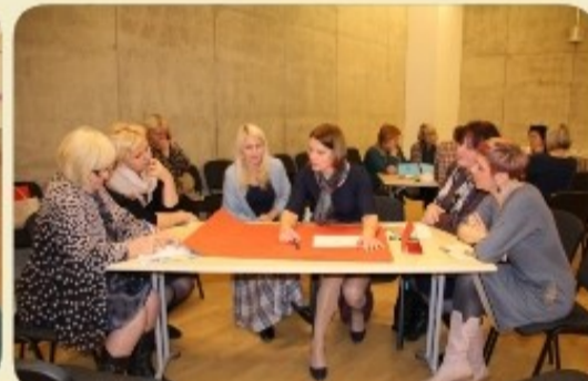
Interesu izglītības skolotāju forums 2016