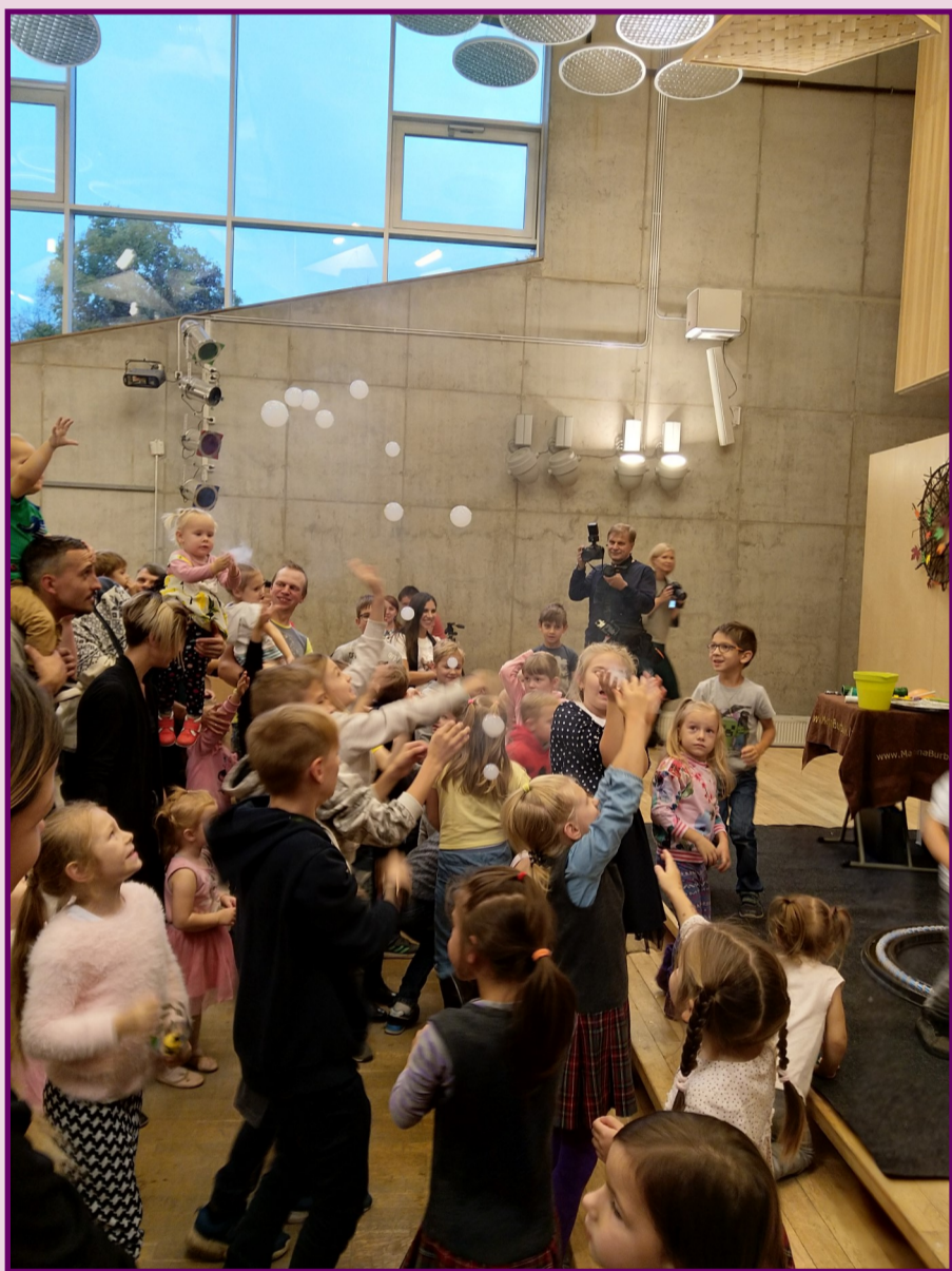
padzīvot burbuļa iekšpusē.

Nosaukums izklausījās diezgan nopietns un arī pieteiktie atribūti tiešām radīja īstas laboratorijas iespaidu. Gan jaunākie, gan vecāko klašu bērni labprāt pārtērpās par mistiķiem un laborantiem, fotografējās kā varoņi no „Harija Potera” filmas. Tomēr visvairāk uzmanības pasākuma laikā dalībnieki veltīja dažādajiem trikiem ar ziepju burbuļiem, drūzmējoties ap visu skatuvi. Te nez no kurienes gaisā uzvirvoja gan jau ierastie, gan gluži piesātināti, balti burbuļi, kurus katrs mēģināja noķert un noturēt pirkstos. Drosmīgākie arī paši varēja tajos iekļūt un