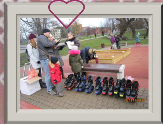
Jaunākie „Zeimuļa” dalībnieki sagaida Latvijas simtgadi!